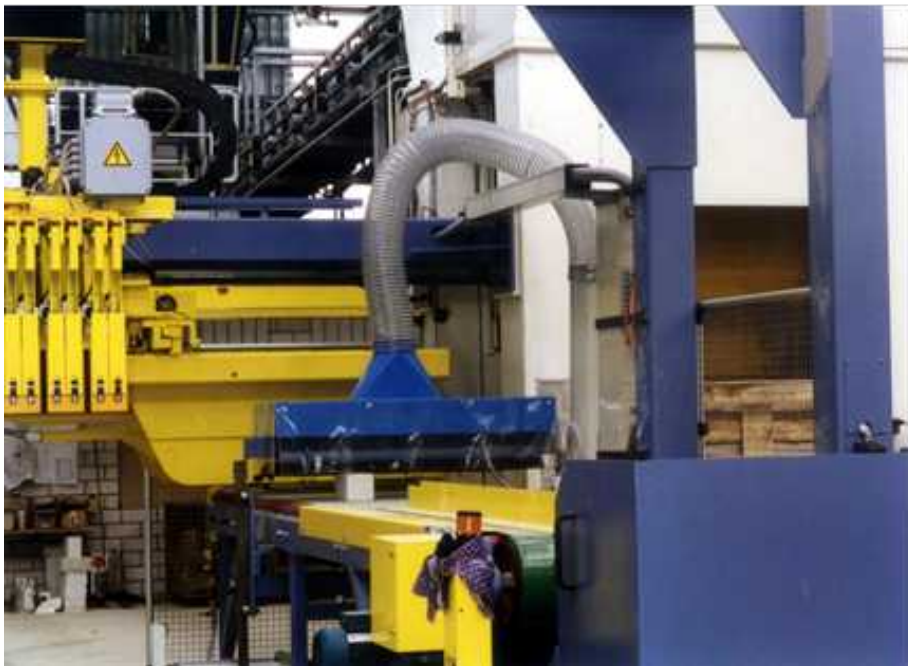
Bürstenabsaugung in der Kalksandsteinindustrie