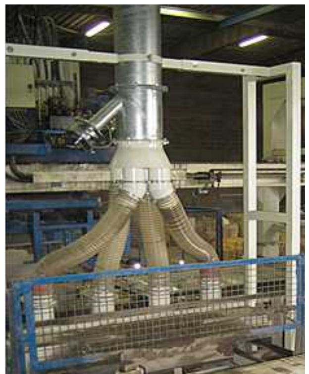
Staubfassung mit 8.000 m 3 /h an einer Palettenbürste